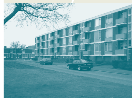
Groenkosten, zie blz. 4

Bij deze nodigen wij u uit voor de Algemene ledenvergadering van de Huurdersvereniging op woensdagavond 23 november 2005. De ledenvergadering wordt gehouden in het Kolpinghuis, Smetiusstraat 1 te Nijmegen. De vergadering begint om 20.00 uur. Vanaf 19.30 uur is de zaal open en staat de koffie klaar.